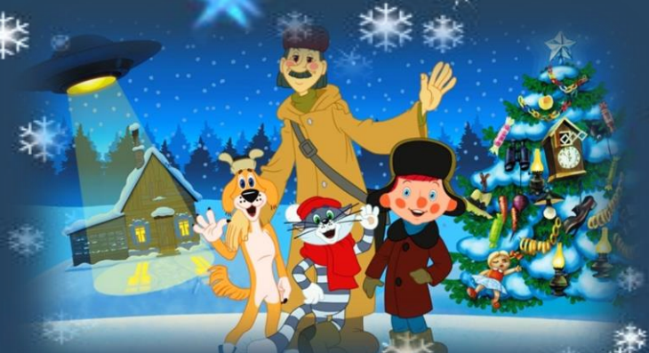
Трое из простоквашино