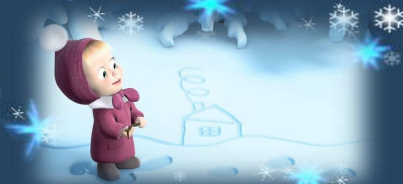
Маша и медведь